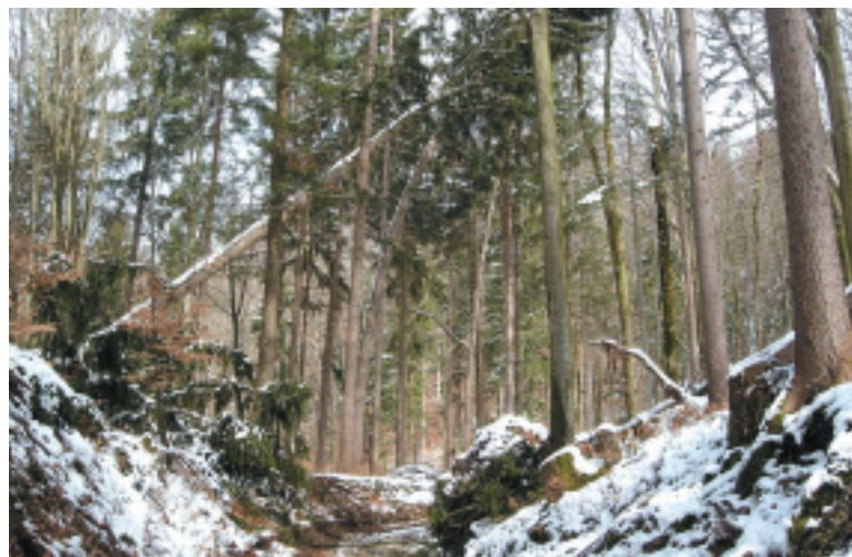
◀ Eine solche Situation an einem Wanderweg kann für den Grundbesitzer kritisch werden.

schränkt sich jedoch nicht nur auf den technischen Zustand des Weges, sondern auch auf mögliche Gefährdungen durch den angrenzenden Waldbestand. Keine Haftung besteht jedoch abseits der Wege, also im Bestandesinneren, auf Rückwegen, Trampelpfaden, Jagdsteigen etc. Dieser Haftungsumfang ergibt sich aus § 176 ForstG 1975, der jedoch als „lex specialis“ auf die Vorsätzlichkeit oder grobe Fahrlässigkeit abstellt. Es gilt der Rechtssatz: Die Haftung für umstürzende Bäume entlang den Forststraßen soll keineswegs überspitzt und auch nicht an den Ansprüchen gemessen werden, die für die Sicherheit von Straßen und Wegen im öffentlichen Bereich, auch für Parkanlagen, gelten müssen (OGH vom 2. Oktober 1991, Zl. 16 R 157/91).